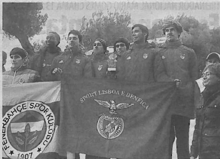
FESTA. Atletas encarnados celebraram êxito em Castellón